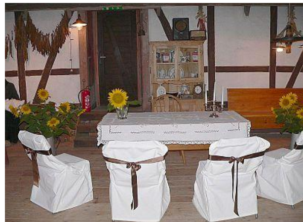
Trauraum im Museum

Aktuelle Termine für Brautpaare, die im Knielinger Museum im Jahr 2010 heiraten wollen: